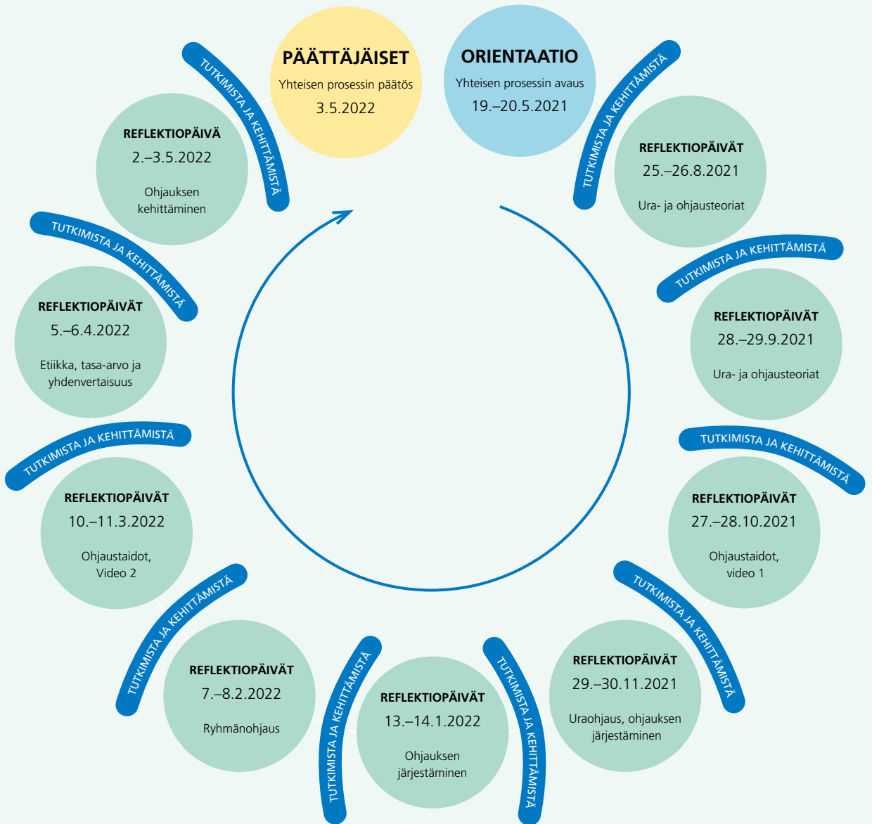
Kuvio 2. Reflektiopäivät opinto-ohjaajakoulutuksessa.