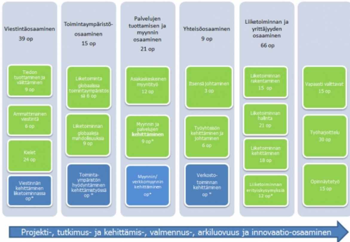
Kuvio 2: Tradenomin opintojen rakenne, moduulit ja opintojaksot. (Siniset laatikot kuvaavat vapaasti valittavia moduuliointoja) * opintopistemäärä yksilöllisesti valittavissa.

Opiskelija voi henkilökohtaisen opetussuunnitelmansa mukaisesti hyödyntää Campuksen tarjoamaa mahdollisuutta toimia eri koulutusohjelmien projekteissa ja opintokokonaisuuksissa suomen, ruotsin ja englannin kielellä, mikä laajentaa hänen erikoistumismahdollisuuksiaan.