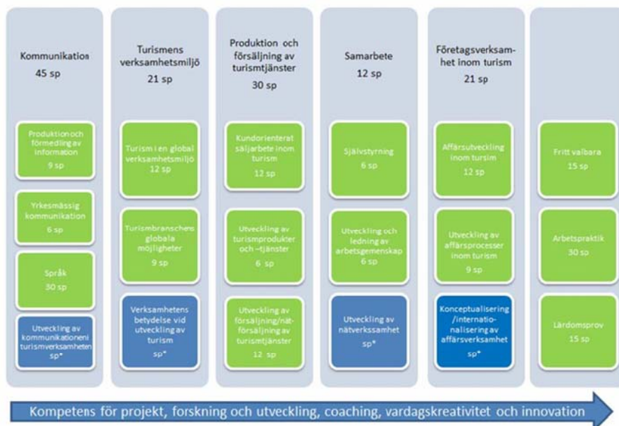
Figur: Struktur, moduler och studieperioder för restonomstudier. (De blå rutorna representerar fritt valbara studier) * Individuellt val av studiepoäng

Restonomutbildningens studiemoduler presenteras i figur. De gröna rutorna representerar obligatoriska studier och de blå alternativa eller fritt valbara. Av studierna bör 15 studiepoäng avläggas på ett främmande språk. Studiemodulernas kurshelheter är övergripande, men dock minst 3 sp till omfattningen och delbara med tre.