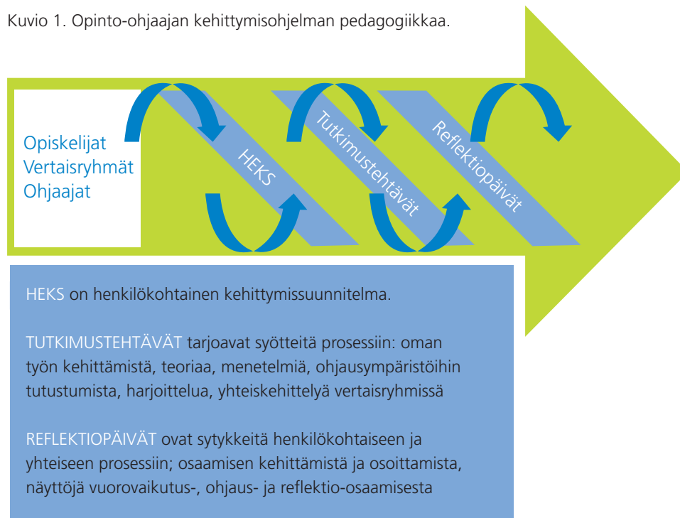
Kuvio 1. Opinto-ohjaajan kehitysohjelman pedagogiikkaa.

paa kokemusta opetus- ja ohjaustyöstä. Pedagogiikka ja menetelmät koulutuksessa tukevat ohjaustyön käytänteistä nousevien kysymysten ratkaisemista ja osaamisten kehittämistä. Ammattitoiminnan arjesta kumpuavat ilmiöt otetaan koulutuksessa yhteisen tutkimuksen ja kehittämisen kohteeksi. Tutkimista ja kehittämistä ohjaavat tutkimustehtävät.