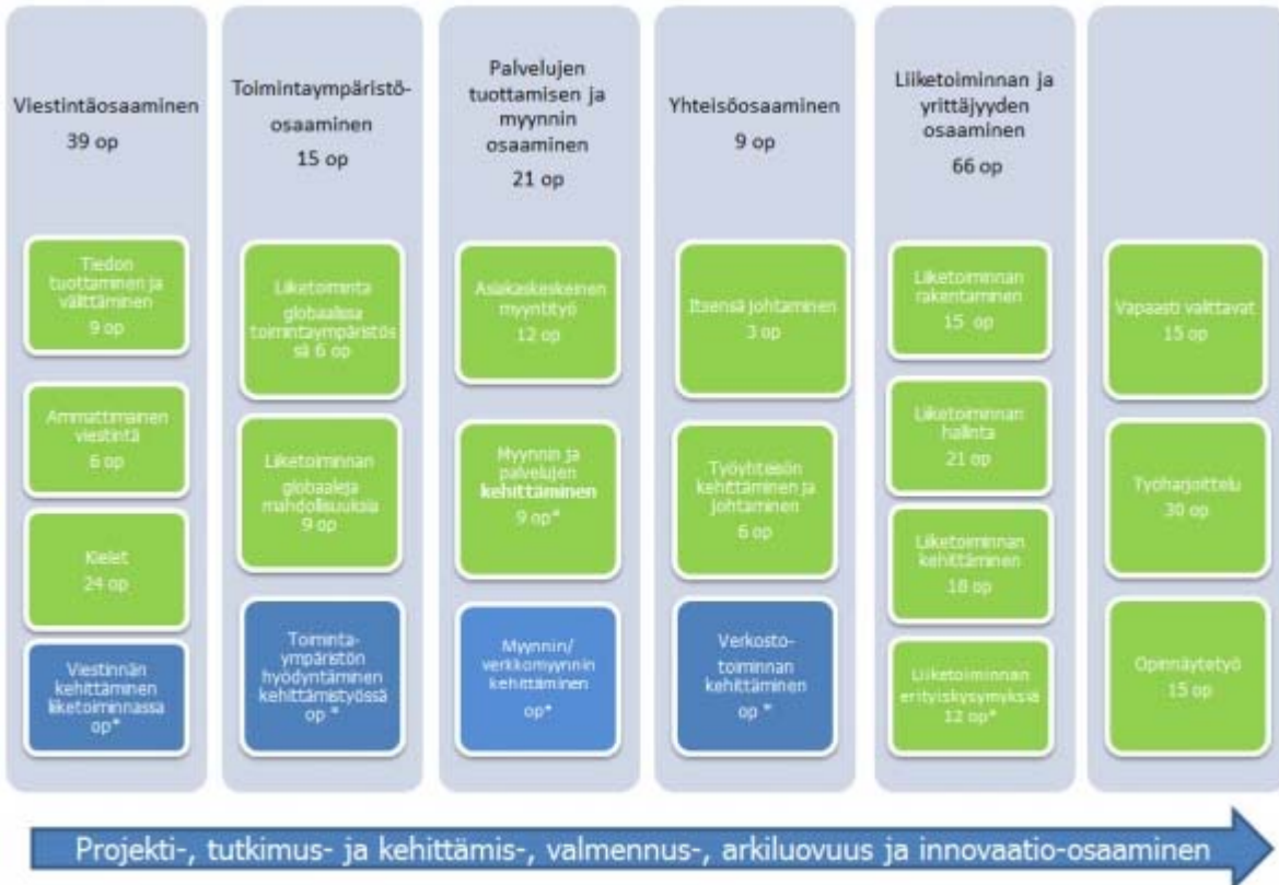
Kuvio 2: Tradenomin opintojen rakenne, moduulit ja opintojaksot. (Siniset laatikot kuvaavat vapaasti valittavia moduuliointoja) * opintopistemäärä yksilöllisesti valittavissa.

Opiskelija voi henkilökohtaisen opetussuunnitelmansa mukaisesti hyödyntää Campuksen tarjoamaa mahdollisuutta toimia eri koulutusohjelmien projekteissa ja opintokokonaisuuksissa suomen, ruotsin ja englannin kielellä, mikä laajentaa hänen erikoistumismahdollisuuksiaan.