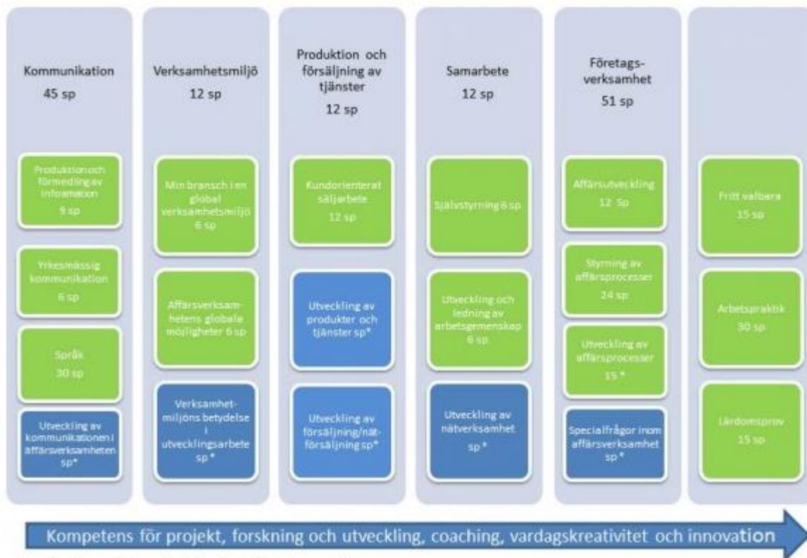
Figur: Struktur, moduler och studieperioder för tradenomstudier. (De blå rutorna representerar fritt valbara studier) * individuellt val av studiepoäng