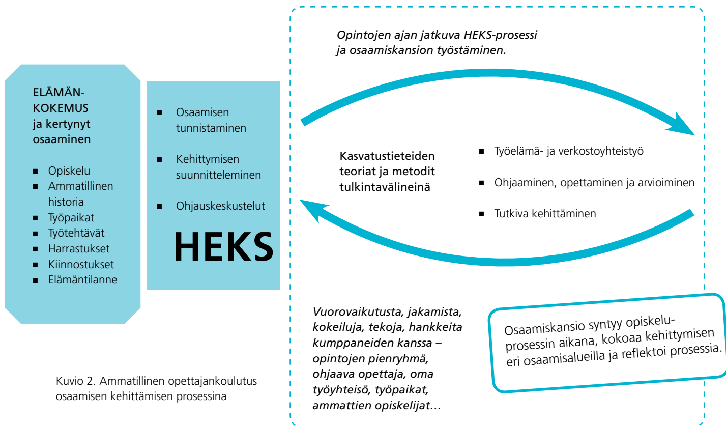
Kuvio 2. Ammatillinen opettajankoulutus osaamisen kehittämisen prosessina

Osaamiskansio on keskeinen HEKS-prosessin väline, jonka muodon ja toteutustavan opettajaopiskelija voi valita itselleen tarkoituksenmukaisesti. Sisältönä osaamiskansiossa on muun muassa eri osaamisalueisiin liittyvät koivat arvioinnit. Osaamisen kehittymisen arviointi alkaa opintojen alussa ja jatkuu opintojen ajan. Opintojen päättyessä osaamiskansiossa kootaan yhteen kehittyminen ja saavutettu osaaminen. Osaamiskansio toimii näyttönä suoritetuista opettajaopinnoista. Ohjaussuhde päättyy osaamiskansion pohjalta käytyyn koko opiskeluprosessin ja osaamisen kehittymisen arviointiin. (Kuvio 2)