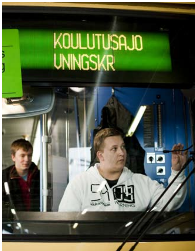
Opetuksellisilla taidoilla laatua työelämään.

sen täytyy tapahtua koulutuksen sisällä, laatua pitää tulla. Yksi seikka on juuri tämä ajo-opettajien koulutus, jotta he pystyvät toimimaan tehokkammin, Kuusniemi sanoo.